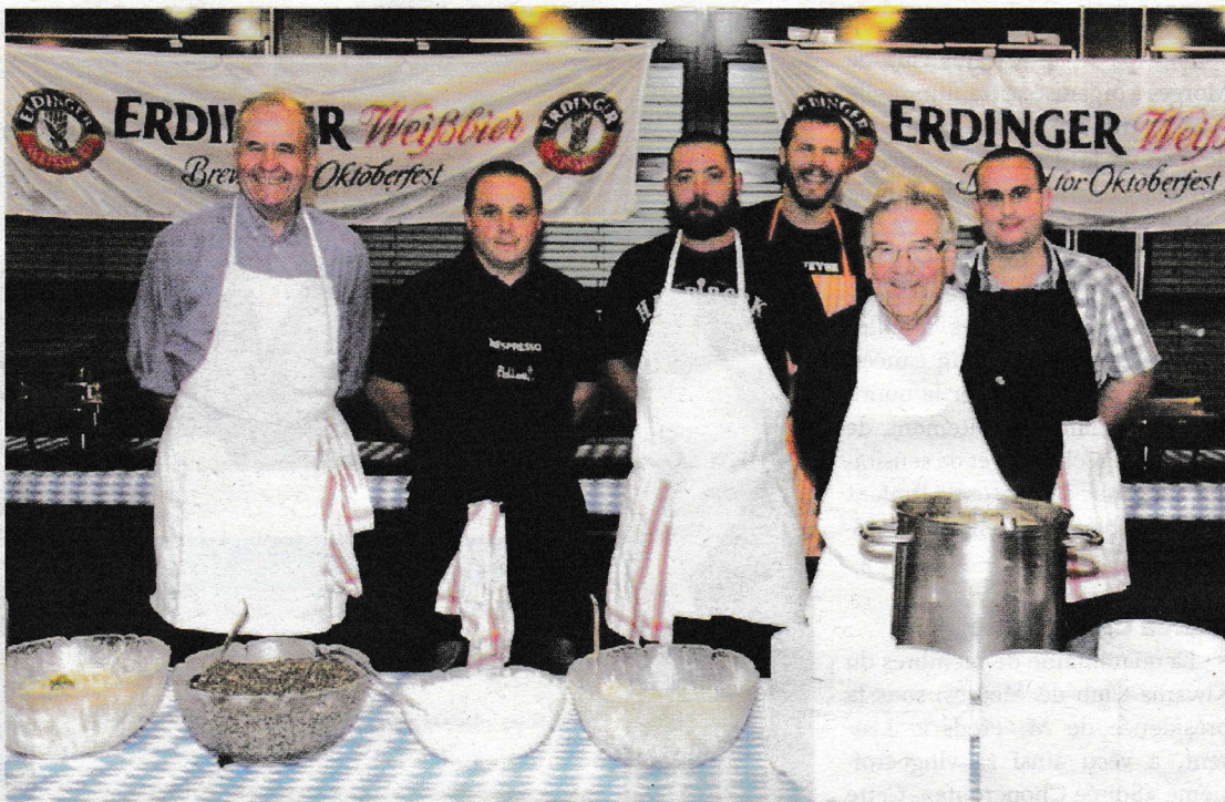
L'équipe de cuisine attend ses premiers clients de pied ferme.

Les dirigeants du club n'étaient pas en reste eux non plus, puisqu'ils avaient tous revêtu le costume traditionnel des amateurs de saucisses et autres ripplis. Dans le hall, les convives étaient attendus pour l'apéritif, puis ont passé à table pour, après des salades et hors d'œuvre variés, déguster une solide choucroute garnie que les puristes ont évidemment accompagnée de bière, quelques rebelles préférant cependant le p'tit coup de banc bien vaudois.